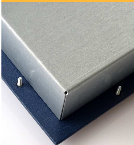
Des composants de qualité