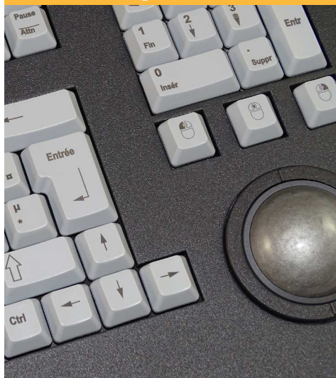
Technologie course longue