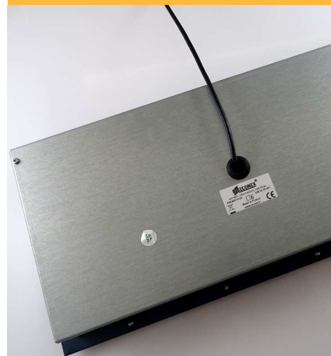
Une technologie d'exception